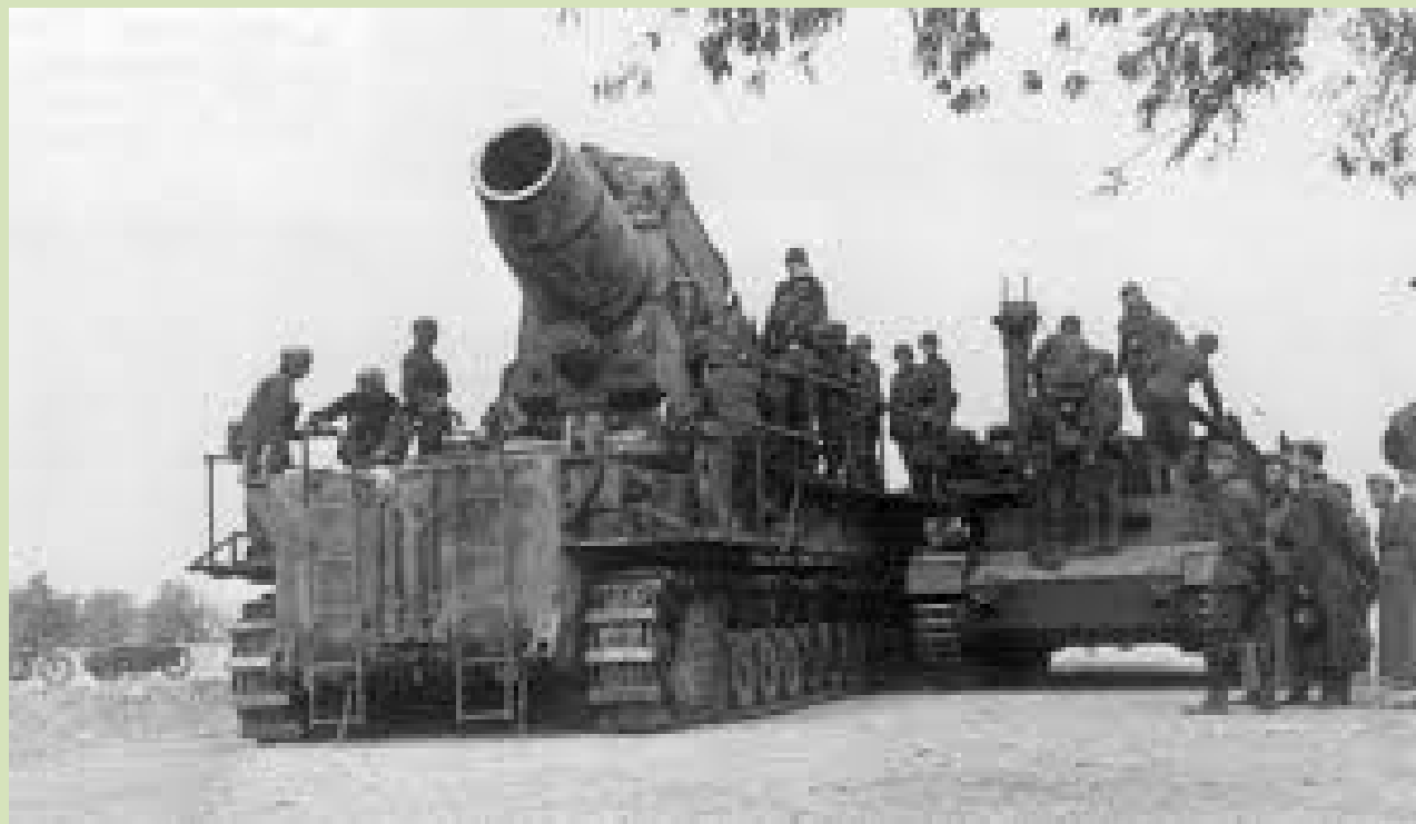
Munitie laden bij een Karl Gerät.

Dragon komt in januari met een bouwdoos van dit vernuftige apparaat in schaal 1/35 inclusief bemanning. In februari in de winkel voor €94,95 euro. Afgehaald in de winkel krijgt u daarop 10% korting.