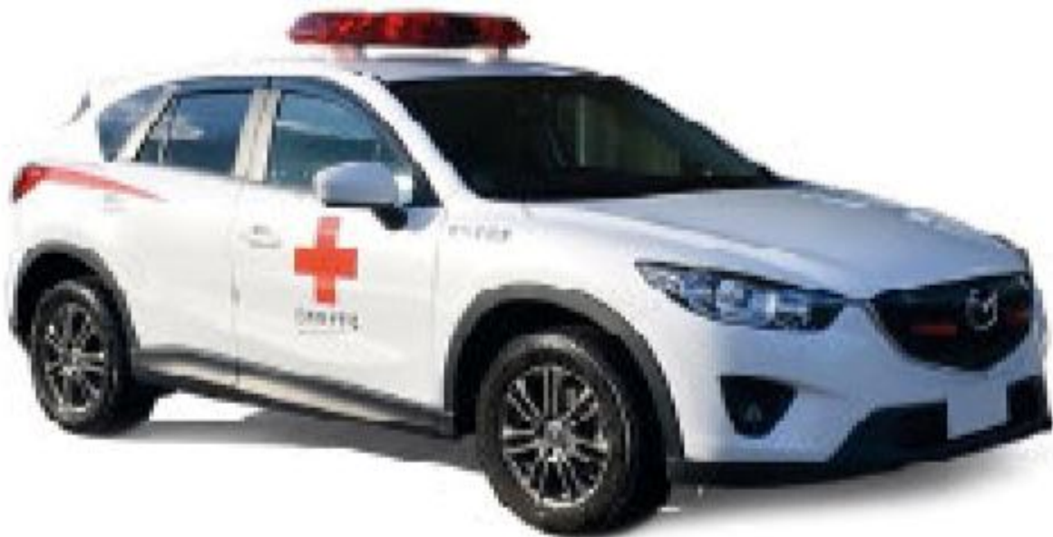
PREMIUM CLASSIXXS 487 – 1/43 – 2013 MAZDA CX-5 – JAPANESE RED CROSS – 11/18 – €47,95 – RESERVEREN