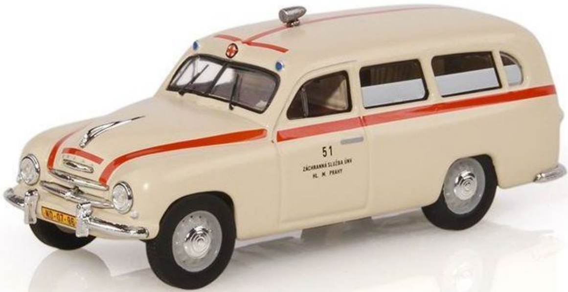
ABREX 143SX718XO – 1/43 – 1956 SKODA 1201 AMBULANCE – 11/18 – €74,95 – RESERVEREN

Op de vermelde prijzen krijgt u 10% korting als u de modellen bij ons afhaalt. Bij postorders vervalt de afhaalkorting, maar brengen wij geen kosten in rekening voor verpakking en verzending bij leveringen in Nederland met een minimumwaarde van € 75,00.