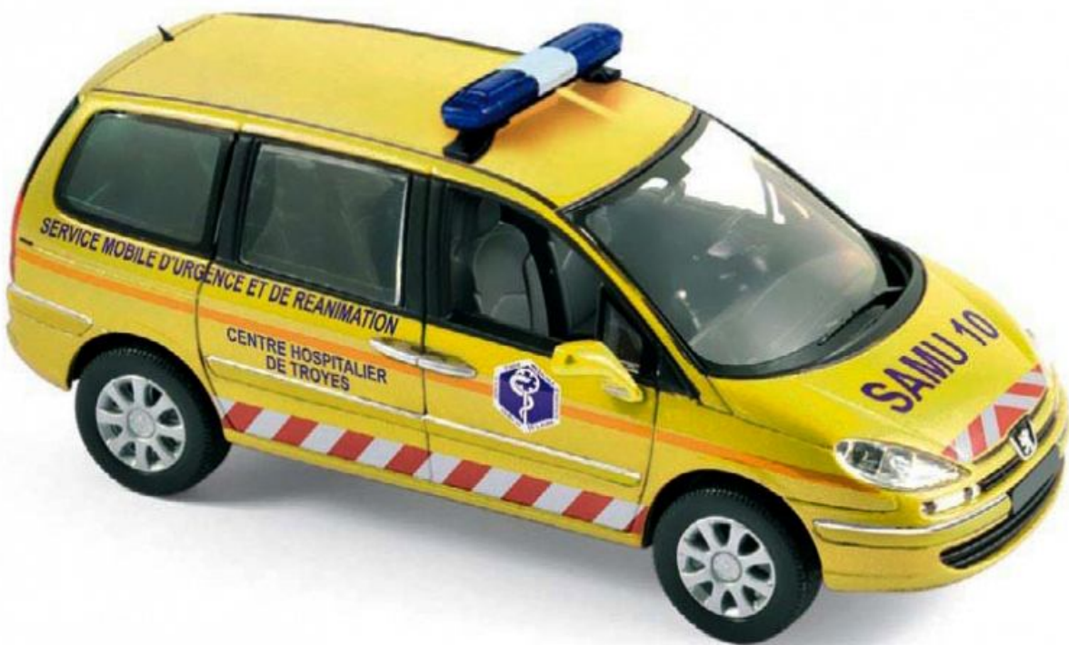
NOREV 478710 – 1/43 – 2013 PEUGEOT 807 – SAMU – 11/18 – €47,95 – RESERVEREN