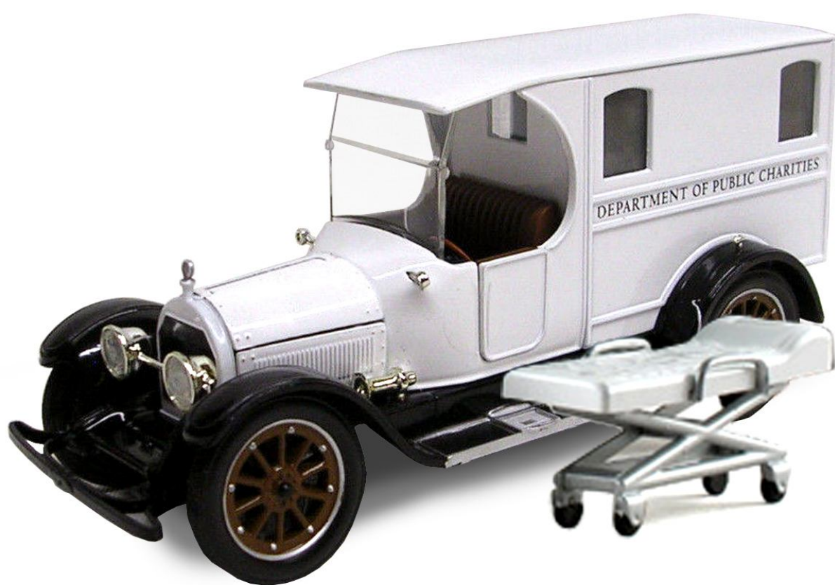
SIGNATURE 32428 – 1/32 – 1918 YORK HOOVER AMBULANCE – MET BRANCARD – 12/18 – €27,95 -- RESERVEREN