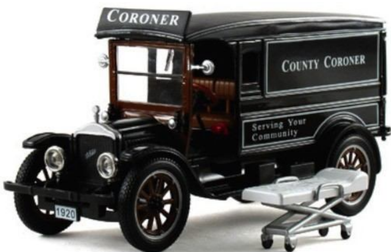
SIGNATURE 32427 – 1/32 – 1920 WHITE AMBULANCE – COUNTY CORONER – 12/18 – €27,95 – RESERVEREN