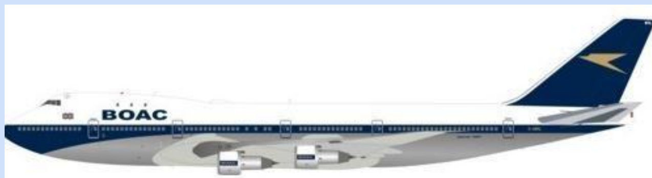
INF WB741BOACNLP – 1/200 – BOEING 747-100 – BOAC – G-AWNL – 09/18 – €189,95 – RESERV.