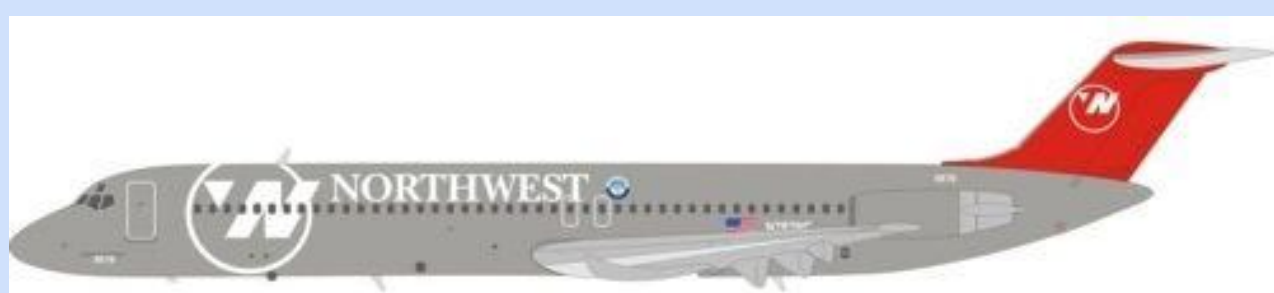
INF WBDC951NW01 – 1/200 – DC-9-51 – NORTHWEST AIRLINES N787NC – 08/18 – €99,95 – RES.

Ook de volgende modellen van InFlight in schaal 1/200 worden in augustus en september bij de Europese distributeur verwacht.