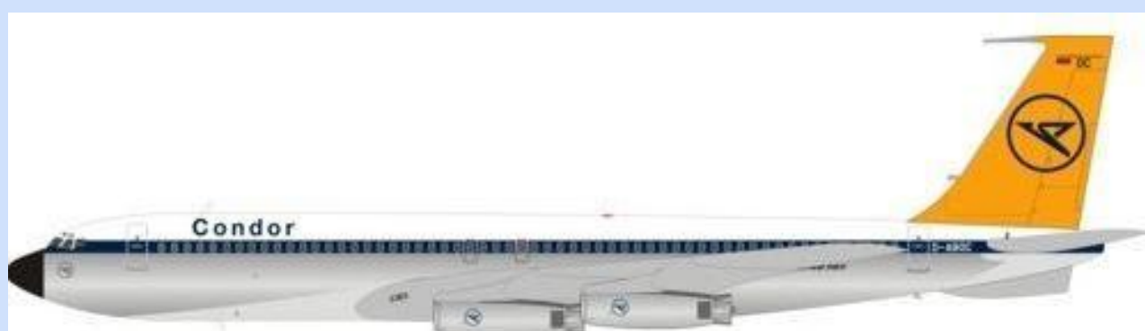
INF WB704DE001P – 1/200 – BOEING 707-430 – CONDOR – D-ABOC – 09/18 – €134,95 – RESERV.