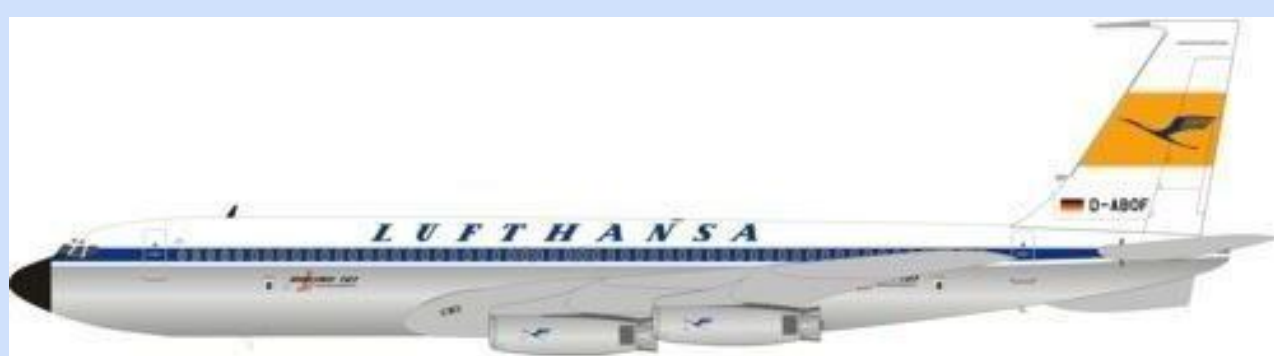
INF WB704LH001P – 1/200 – BOEING 707-430 – LUFTHANSA – D-ABOF – 08/18 – €134,95 – RES.