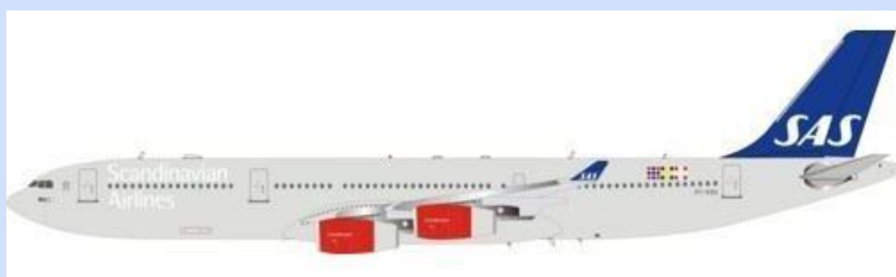
INF 343SK0618 – 1/200 – AIRBUS A340-300 – SAS – OY-KBA – 08/18 – €157,95 – RESERVEREN