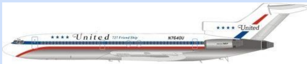
INF 722UA0618 – 1/200 – BOEING 727-200 – UNITED AIRLINES – N7640U – 09/18 – €109,95 – RES.