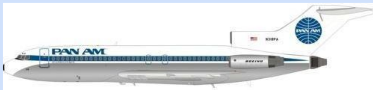
INF 721PA02 – 1/200 – BOEING 727-100 – PAN AMERICAN N318PA – 09/18 – €107,95 – RESERV.