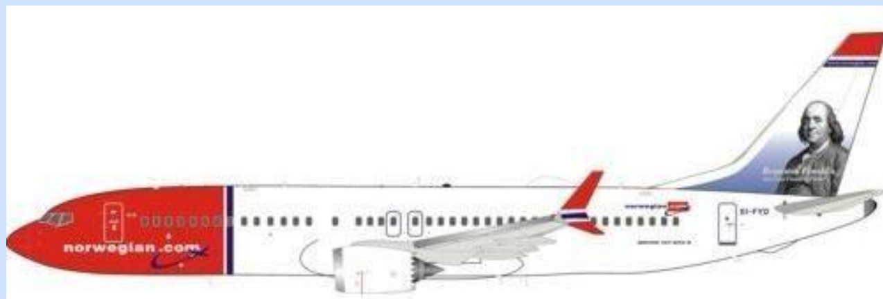
INF 738MAXSK02 – 1/200 – BOEING 737-8MAX – NORWEGIAN AIR – EI-FYD – 08/18 – €99,95 – RES.