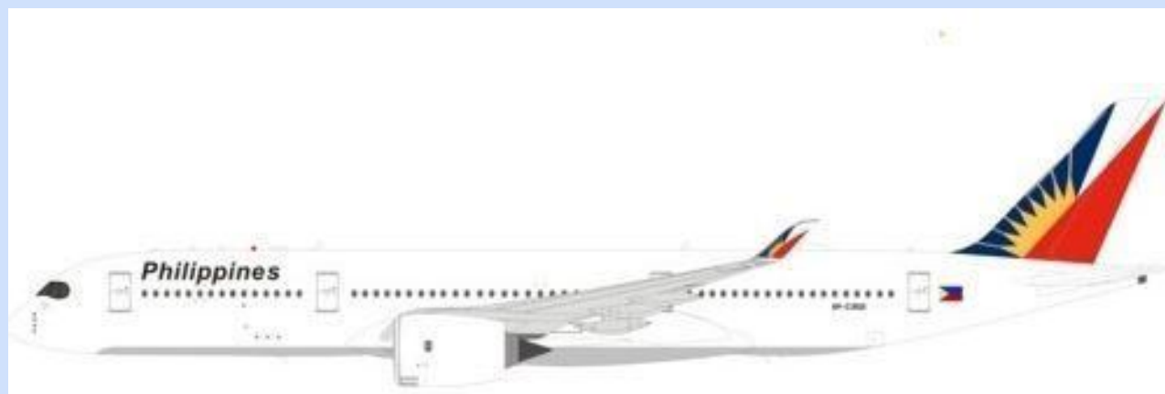
INF 350PAL0718 – 1/200 – AIRBUS A350-900 – PAL – RP-C3501 – 09/18 - €157,95 – RESERV.