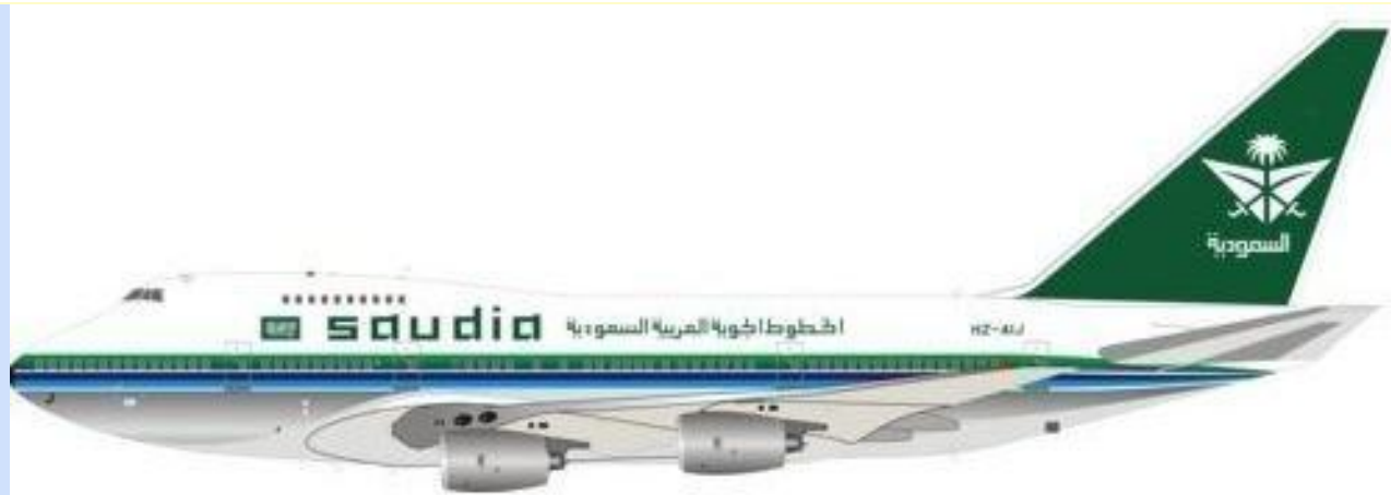
INF 747SPSV0818P – 1/200 – BOEING 747SP-68 – SAUDIA – 08/18 – €187,95 – RESERVEREN