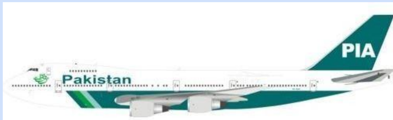
INF 742PK0818 – 1/200 – BOEING 747-200 – PIA – AP-BAK – 08/18 – €179,95 – RESERVEREN