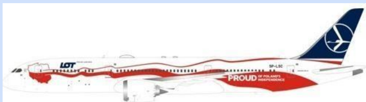
INF 7890718 – 1/200 – BOEING 787-9 – LOT – SP-LSC – 09/18 – €157,95 – RESERVEREN